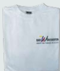
T-Shirt 10,20 €