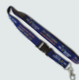
VIP-Band 3,45 €