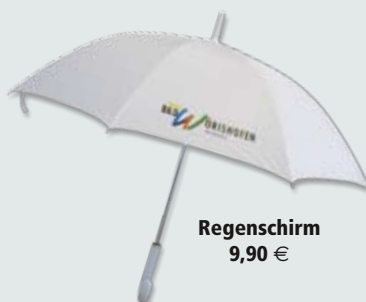
Regenschirm 9,90 €