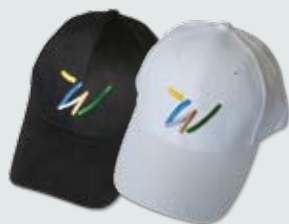
Cap 5,90 € / Stück

Bestellen Sie unsere Souvenirs online unter www.bad-woerishofen.de als Erinnerung an die schöne Zeit in Bad Wörishofen oder als kleines Präsent für Familie und Freunde.