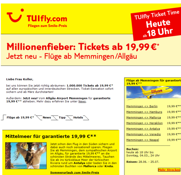
Abb. 3 - Newsletter