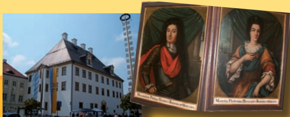
Schloss und Herzogspaar

Das denkmalgeschützte Straßenensemble erschließt sich von Süden durch das Ludwigstor, das 1829 anlässlich seines Besuches in Türkheim zu Ehren König Ludwig I. zum Triumphbogen umgestaltet wurde.