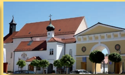
Pfarrkirche, Lorettokapelle und Kapuziner-Klosterkirche

Die Pfarrkirche Mariä Himmelfahrt mit ihrem imposant-markanten Turm, die Lorettokapelle, einst Hofkapelle und Wallfahrtsstätte, sowie die Kirche des ehemaligen Kapuzinerklosters zeugen von einer barocken und religiös geprägten Vergangenheit. Türkheim liegt am Jakobsweg, der auch heute noch Pilger in den Ort führt. Selbst Pfarrer Sebastian Kneipp wirkte ab 1859 in dem von den Dominikanerinnen geführten Kloster- und Mädcheninstitut.